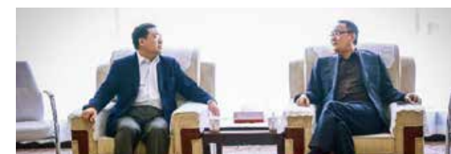
董事长会见民生银行马琳行长