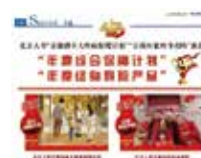
年度综合保障计划 年度终身寿险产品