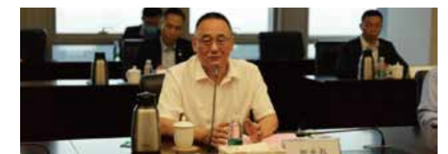
董事长在北京人寿-北京农商银行战略合作协议签署仪式上致辞