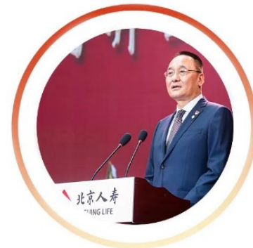
北京人寿党委书记、董事长

2026年是“十五五”规划实施的开局之年，也是承前启后巩固经济回稳态势的关键之年。国家“十五五”规划及中央经济工作会议为保险行业高质量发展指明方向，为商业保险深度参与民生保障开辟了更广阔的空间。展望2026年，北京人寿将深刻把握“十五五”时期经济社会发展的重要方向，以中央经济工作会议精神为根本指引，持续深化“保险+康养”双轮驱动战略，实现业务稳健增长与核心优势锻造的同时，着眼于长远可持续发展，布局重点机构、深耕健康及养老等领域，为开辟长期增长空间奠定坚实基础，以实际行动助力“金融强国”建设。