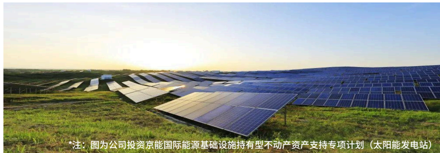
*注：图为公司投资京能国际能源基础设施持有型不动产资产支持专项计划（太阳能发电站）

为加强节水节电，安装节水器具与节能净水设备，杜绝长流水；推广LED灯，充分利用自然光，及时关闭设备电源；空调夏季 \geq 26^{\circ}\text{C} 、冬季 \leq 20^{\circ}\text{C} ，定期检查用电安全。推广可重复使用办公用品，优先采购环保耐用产品，实行领用制度。鼓励步行、骑行、公交等低碳出行并给予补贴，公务用车优先选用新能源或低排放车辆，提前规划路线减少空驶。