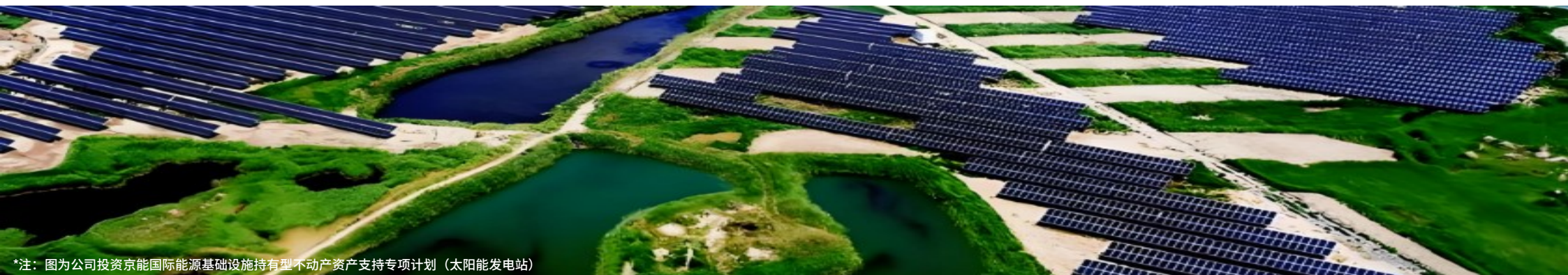
*注：图为公司投资京能国际能源基础设施持有型不动产资产支持专项计划（太阳能发电站）

未来，公司持续推进建立绿色债券、基金、另类项目的动态监测池和产品储备库，重点关注清洁能源、节能环保等领域，依据市场情况及公司整体投资计划，择机进行配置。同时，公司不断完善ESG方面的管理细则和投资流程，在各投资品种立项会中增加绿色投资评估环节，不断优化工作机制，持续加大对ESG领域的支持力度，积极履行企业社会责任。